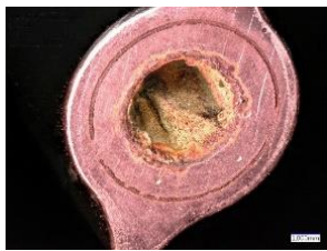
Hier musste die Produktion unterbrochen werden, da Kern gerissen. Kühlwasser dringt in Formnest ein.