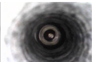
Live Bild rechts mit Herkor® bei gleicher Laufzeit.

Zykluszeiten reduzieren sich durch zugesetzte Kühlungen. Mangelnde Kühlung und Temperierung bedeutet erhöhten Ausschuss und einen enormen Wartungsaufwand. Ablagerungen und Korrosion werden ausgewaschen.